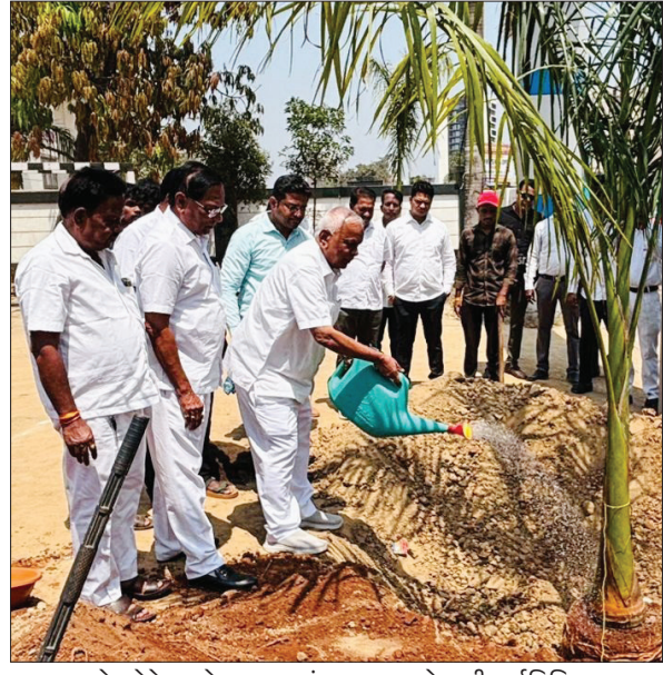
लोकनेते रामशेट ठाकूर यांच्या अमृतमहोत्सवी वर्षानिमित्त