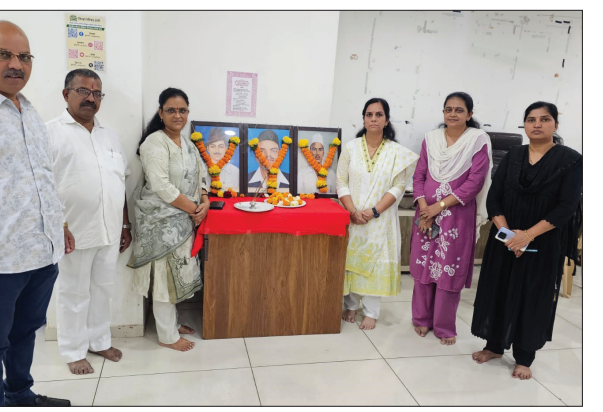
स्वातंत्र्यलढ्यात आपल्या प्राणांची आहुती देणारे महान क्रांतिकारक शहीद भगतसिंग, सुखदेव व राजगुरू यांच्या पुण्यतिथीनिमित्त जिल्हा परिषद ठाणे येथे त्यांना भावपूर्ण अभिवादन करण्यात आले. जिल्हा परिषदेच्या पशुसंवर्धन विभागात आयोजित कार्यक्रमाला त्यांच्या प्रतिमेस पुष्पहार अर्पण करून कृतज्ञतापूर्वक स्मरण करण्यात आले. यावेळी उपस्थितांनी देशासाठी दिलेल्या त्यांच्या पवित्रदानाची आठवण ठेवत त्यांच्या विचारांचे अनुसरण करण्याचा संकल्प व्यक्त केला.