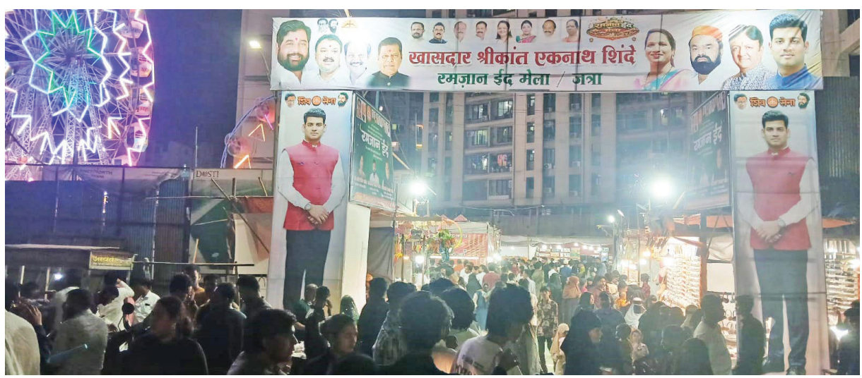
खासदार श्रीकांत एकनाथ शिंदे यांच्या पुढाकाराने दोस्त, मुंब्रा व दिवा परिसरातील रमजान ईद मेला- जत्रेचे आयोजन करण्यात आले. या मेळाव्यास नागरिकांनी उत्कृष्ट प्रतिसाद देत मोठ्या संख्येने उपस्थिती लावली. विविध खाद्यपदार्थांचे स्टॉल, खेळणी व मनोरंजनाच्या साधनांमुळे परिसरात उत्सवी वातावरण निर्माण झाले. सामाजिक ऐक्य व बंधुभाव वृद्धिंगत करण्याच्या उद्देशाने आयोजित या जत्रेला स्थानिक नागरिकांनी भरभरून प्रतिसाद दिला.

सांगितले की, "उत्कर्ष स्मॉल फायनान्स बँकेचे मुंबई इंडियन्स परिवारात स्वागत करताना आम्हाला आनंद होत आहे. त्यांची मजबूत मूल्ये, ग्राहक-केंद्रित दृष्टिकोन आणि आर्थिक समावेशनाबाबतची बांधिलकी आमच्या विचारसरणीशी सुसंगत आहे. आम्ही प्रभावी भागीदारीची अपेक्षा करतो." या भागीदारीचा एक भाग म्हणून, उत्कर्ष स्मॉल फायनान्स बँकेचे चे उद्दिष्ट विविध ग्राहक वर्गांशी आपला संवाद आणि सहभाग वाढवणे, तसेच या हंगामादरम्यान राबवल्या जाणाऱ्या एकात्मिक मार्केटिंग उपक्रमांद्वारे व इतर नियोजित कार्यक्रमांद्वारे आपल्या ब्रँडची उपस्थिती अधिक ठळक करणे आहे.